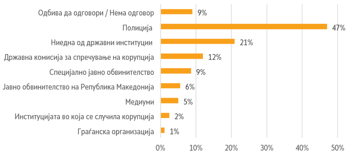
Графикон 4. До кого граѓаните би го пријавиле случајот за корупција, доколку би биле жртва во некој случај на корупција?

Доколку би биле жртва во некој случај на корупција, скоро половина од граѓаните (47%) случајот би го пријавиле во полиција. Секој петти граѓанин (21%) случајот не би го пријавил во ни една државна институција. А по полицијата, ДКСК е следната институција во која граѓаните би го пријавиле случајот (12%).