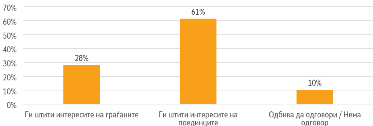
Графикон 6. Мислење на граѓаните колку ДКСК работи во нивни интерес

На прашањето во чиј интерес работи ДКСК, висок е бројот од граѓаните (61%) кои сметаат дека со својата работа ДКСК ги штити интересите на поединците (приватен интерес на политичари, избрани и именувани лица), наспроти 28% од граѓаните кои сметат дека ги штити интересите на граѓаните (јавниот интерес).