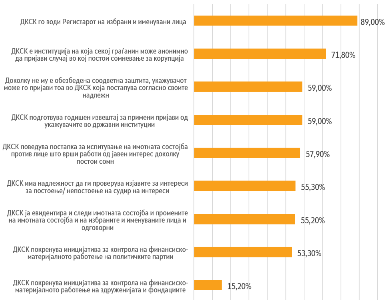
Графикон 2. Познавање на надлежностите на ДКСК од страна на граѓаните

Од истражувањето произлегува дека повеќе од половина граѓани (57,1%) воопшто не се запознаени со тоа што работи ДКСК 8 . Само 4,5% граѓани се целосно запознаени, а 37,7% дека се донекаде запознаени со работата на ДКСК. Од одговорите на прашањето за тоа кои се конкретните активности што треба да ги презема ДКСК, може да се заклучи дека граѓаните не ја познаваат ДКСК и кои се нејзините надлежности. Најмногу граѓани (89%) знаат дека обврската на ДКСК е да го води Регистарот на избрани и именувани лица. Исто така, 71,8% граѓани знаат дека може анонимно да пријават до ДКСК случај во кој се сомневаат дека постои корупција. Од друга страна, дека ДКСК може да покренува иницијатива за контрола на финансиско-материјалното работење на здруженијата и фондациите граѓаните речиси и да не знаат , бидејќи само 15,2% одговориле дека тоа е една од надлежности на Комисијата. Другите надлежности на ДКСК ги препознале од 50 до 60% од граѓаните.