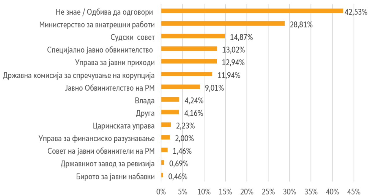
Графикон 3. Дали државните институции придонесуваат во борбата против корупција?

Доколку би биле жртва во некој случај на корупција, скоро половина од граѓаните (47%) случајот би го пријавиле во полиција. Секој петти граѓанин (21%) случајот не би го пријавил во ни една државна институција. А по полицијата, ДКСК е следната институција во која граѓаните би го пријавиле случајот (12%).